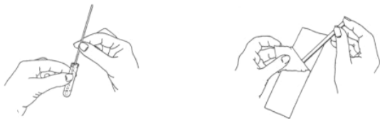
Schéma extrakce tamponu do pufru:

Po vyjmutí tamponu se sekret eluuje v elučním pufru.